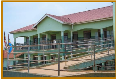
Kibanga Primary School

Maßnahmen haben die Lebensbedingungen der Jugendlichen deutlich verbessert und tragen langfristig zu mehr Stabilität, Sicherheit und einer verlässlichen Betreuung bei.