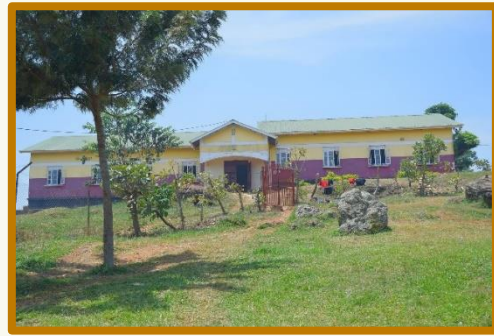
Sserwanga Secondary School